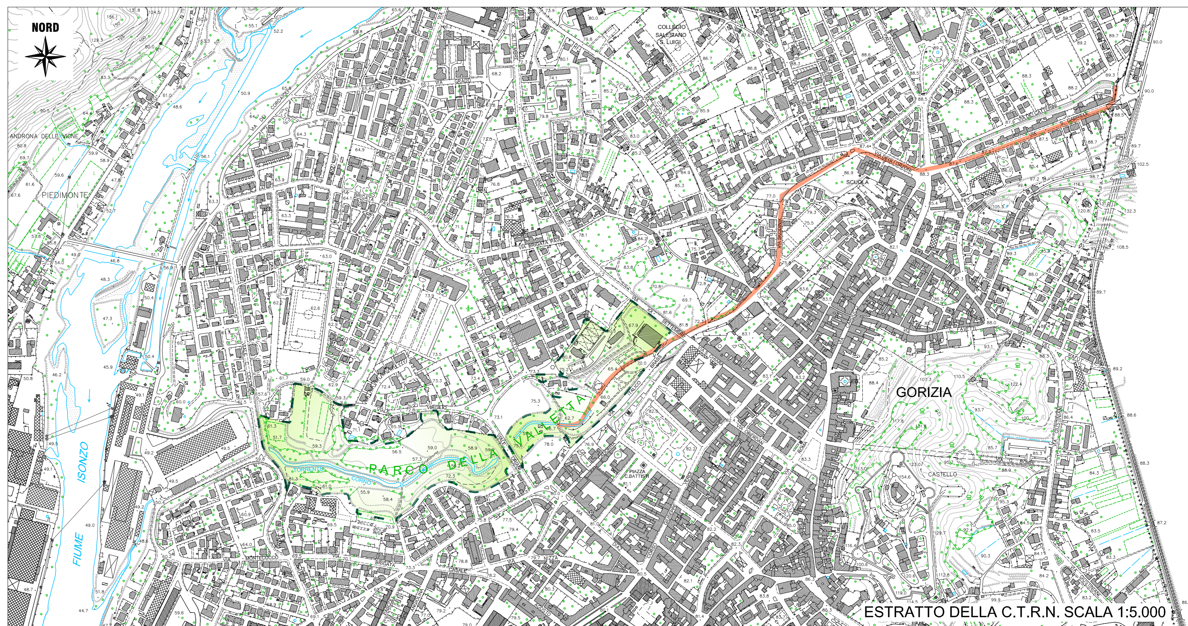
ESTRATTO DELLA C.T.R.N. SCALA 1:5.000