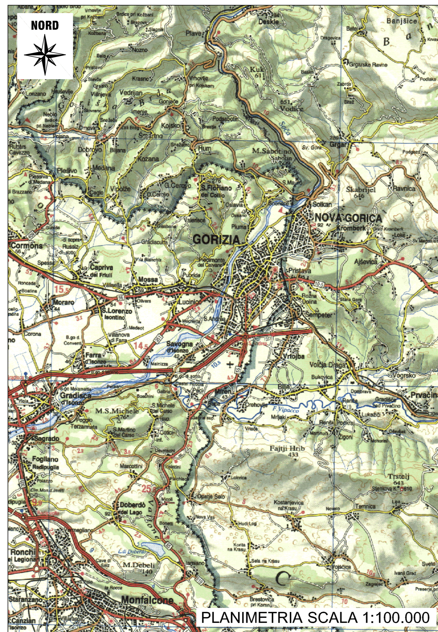
PLANIMETRIA SCALA 1:100.000